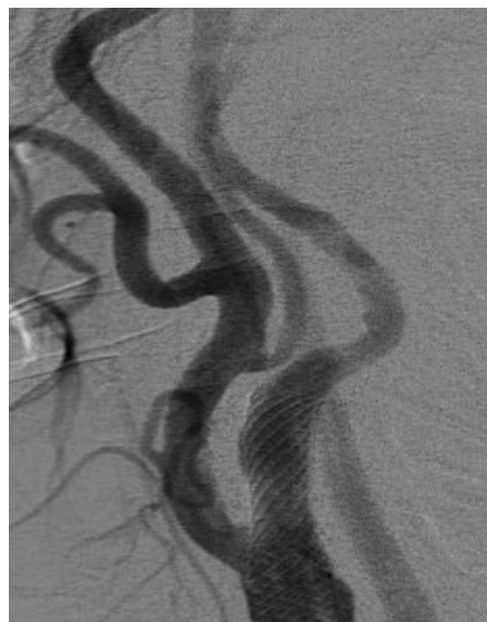
Arteriografie: preoperatief 90 % stenose

Eens de juiste plaats van de vernauwing bepaald is, wordt een draad opgeschoven tot voorbij de vernauwing. Er is altijd een kans dat het technisch niet mogelijk is om met de draad tot voorbij de vernauwing te geraken. In dat geval is de carotisstenting technisch niet mogelijk. Deze kans is echter gering. Daarna wordt over de draad een filter geschoven om eventueel loskomende stukjes op te kunnen vangen. Op deze manier kan grotendeels voorkomen worden dat loskomende stukjes hersenbeschadiging veroorzaken. Vervolgens wordt de stent geplaatst in de vernauwing. Dit veertje (stent) wordt nog volledig opgerekt met een ballon, zodat er geen vernauwing meer is en het letsel door de stent wordt afgeschermd. Tijdens het opblazen van de ballon kunt u wat pijn voelen of wat misselijk worden. Dit gevoel verdwijnt echter binnen een tiental seconden.