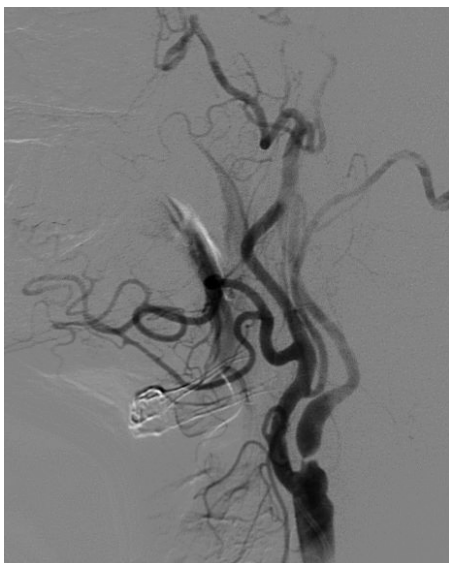
Arteriografie: preoperatief 90 % stenose

Er worden foto's van de bloedvaten gemaakt. Op die manier kan de plaats van de vernauwing of verstopping precies bepaald worden. Het is daarom van het grootste belang om zo stil mogelijk te blijven liggen.