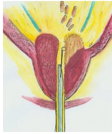
Figuur 3: Door middel van een elektrische lus schraapt de uroloog de binnenkant van de prostaat weg