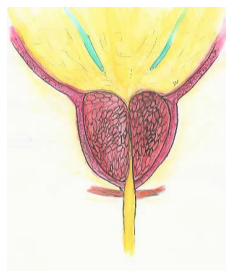
Figuur 2: De twee prostaatkwabben duwen de plasbuis dicht